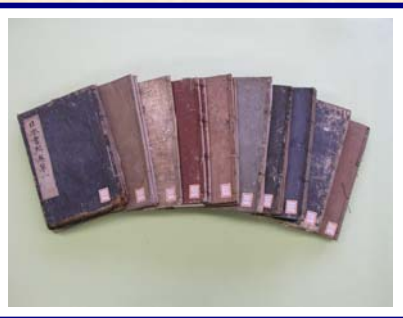
愛媛大学図書館 鈴鹿文庫蔵書 『日本書紀』