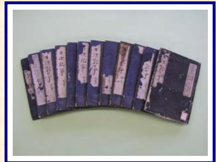
愛媛大学図書館 鈴鹿文庫蔵書 ひなみきじ 『日記』