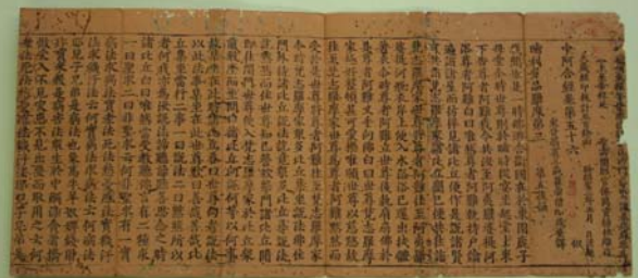
愛媛大学図書館 鈴鹿文庫蔵書 『中阿含経』巻第五十六