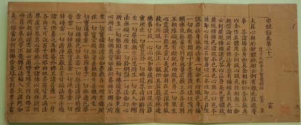
愛媛大学図書館 鈴鹿文庫蔵書 『宗鏡録』巻第二十二