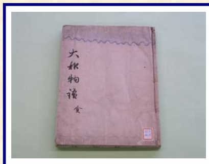
愛媛大学図書館 鈴鹿文庫蔵書 『大和物語』